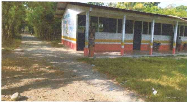
Foto 1: En esta foto podemos observar la estructura física de la escuela