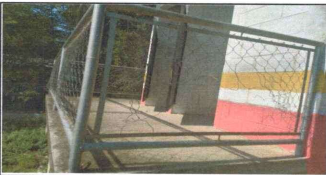
Foto 5: Las puertas de los sanitarios ya no están adecuados para el uso correcto ya que los niños y niñas frecuentan en los baños y están en mal estado las puertas