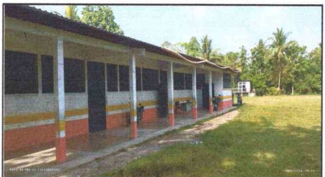
Foto 4: Se necesita cambiarle la pintura al edificio escolar el color que posee actualmente no es el color adecuada