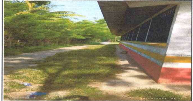
Foto 2: La parte de atrás se necesitan balcones nuevas para estar seguro el edificio escolar.